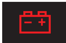
バッテリーランプ