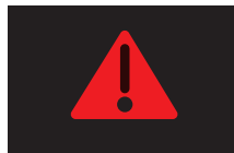
マスターウォーニング