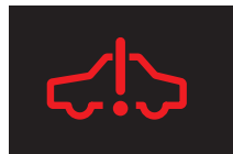
ハイブリッドシステム異常警告灯