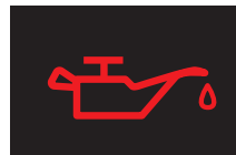
エンジンオイルランプ